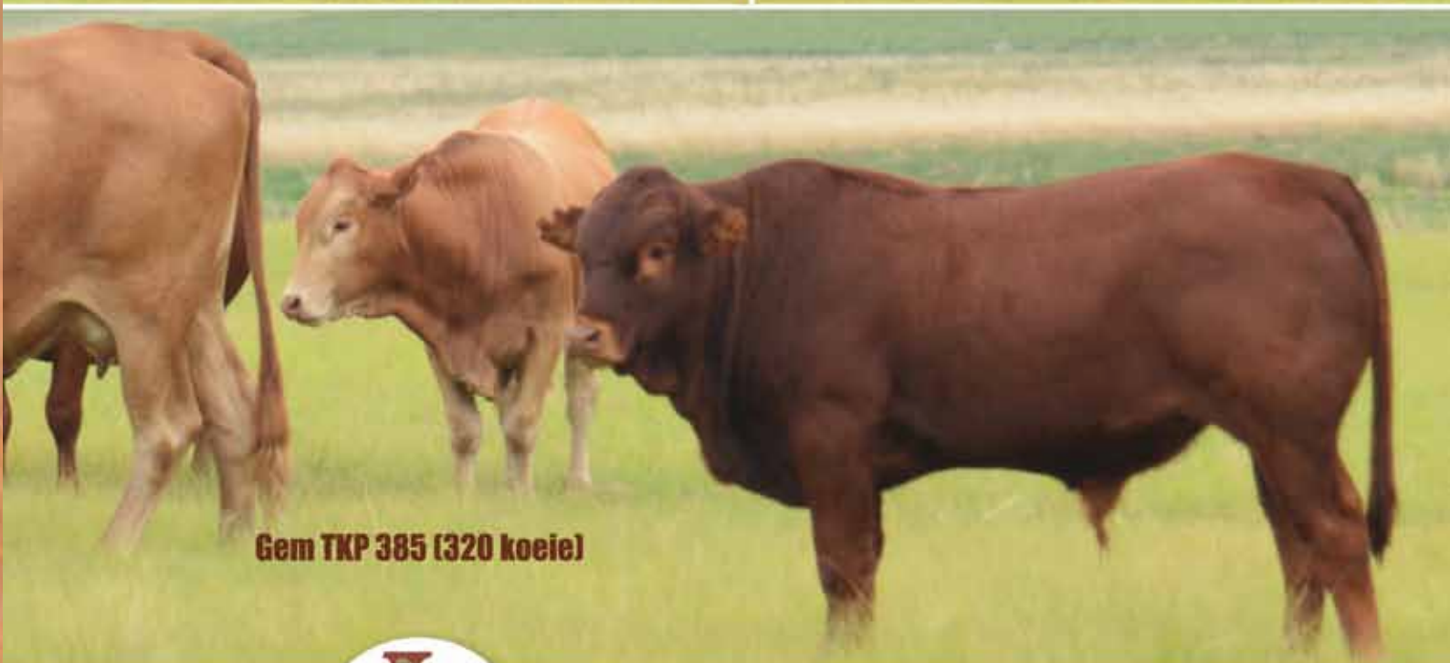
Gem TKP 385 (320 koeie)